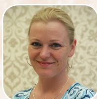
DR. SMOLCZ KATALIN

Ezek a szemölcsök általában apró, gombostüfejnnyi, vagy nagyobb, bőrszínű, világosabb vagy kissé sötétebb, enyhén rovátkált „karfiolszerű” felszínűek, fájdalomtalanok. A nemi szervek környékén bárhol megtalálhatóak, így a külső nemi szervek hámján (penis, kis-és nagyjakak, herezacskó bőre, szeméremdomb, combhajlat), a végbélnyílás környékén, de akár a belső, nyálkahártyával borított felületeken – így a hüvelyben vagy akár a végbélnyíláson belül is. Az orális szexuális együttlét során a vírus megtapadhat a szájnyalkahártyán, garatban is.