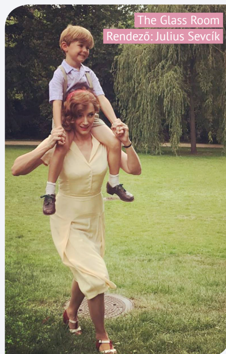
The Glass Room

– Úgy gondolom, a legfontosabb, hogy a család és a barátok ott álljanak az ember háta mögött, hiszen szerintem csak akkor lehet sikeres az ember, hogyha otthon támogatják. Én szerencsésnek mondhatom magam, hiszen jó emberekkel vagyok körülveve, úgyhogy minél több szeretetet, munkát és egészséget kívánok magunknak.