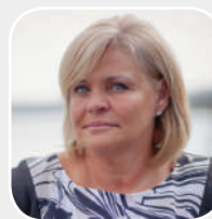
DR. BÉRES ZSUZSANNA

Ez az oka annak, hogy a betegséget követően sokáig köhöghetünk, hiszen a sérült nyálkahártya kevésbé ellenálló a különböző baktériumokkal és vírusokkal szemben, amik jellemzően ebben az időszakban cirkulálnak. A regenerálódás 6-8 hetet vesz igénybe. Csak ekkor mondható el, hogy az eredeti funkció helyre állt. Ez számunkra azt jelenti, hogy ebben az időszakban szövődmények alakulhatnak ki, betegségünk elhúzódóvá válhat, állapotunk csak lassan javul. Egyszerűbben: az influenza fertőzést követően könnyű prédává válunk számtalan kórokozó számára.